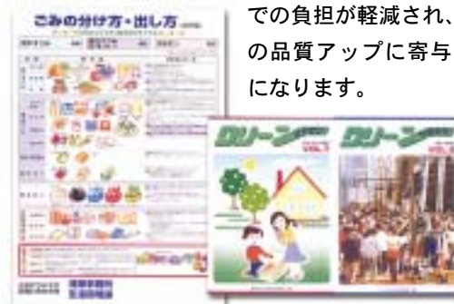
参考文献：「ガラスびん分別収集の手引き」 厚生省水道環境部リサイクル推進