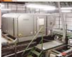
▼赤外線センサによる選別機

ガラスびんの原料であるカレットに対しシビアな品質が求められる状況の中、私どもの工場ではカレットを安定供給すべく、様々な異物選別除去装置の開発・導入を進めています。最近では、従来目視チェックに頼っていた陶磁器類の選別に、赤外線センサーを用いた選別機を導入し、除去率98～99%の高精度を発揮しています。しかし、耐熱ガラスは、機械的な除去が難しく、細かく砕かれてしまったものはカレットとまったく見分けがつかず、目視での手選別が非常に困難です。