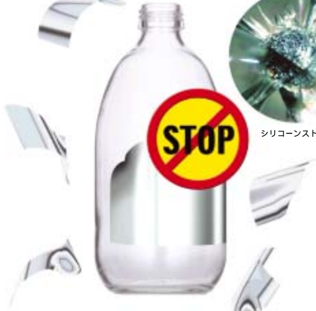
シリコンストーン

リサイクルに影響を及ぼす異物のひとつに、アルミ箔ラベルがあります。カレットの中にアルミ箔ラベルの破片が残ったままで、原料として使われると、ガラスびんの強度を損なうシリコンストーンを生成することがあります。試験データによると、7mm×4mmのごく小さなアルミ箔ラベル片からも、シリコンストーンが生成されることが確認されています。細かく砕かれてカレットに混入したアルミ箔ラベルを、完全に除去することは、きわめて困難です。