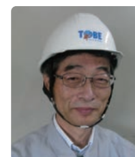
洗びん工場の作業員