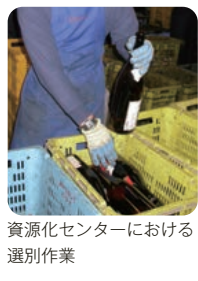
資源化センターにおける選別作業