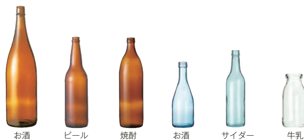
●主なリターナブルびん