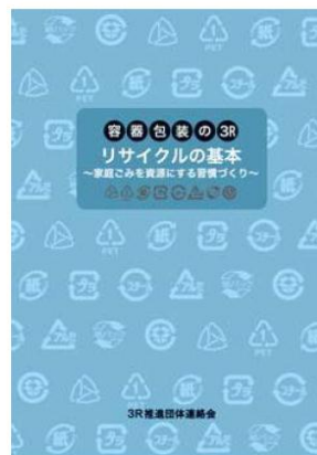
小冊子「リサイクルの基本」

3R リーダー交流会の成果のひとつとして、小冊子「リサイクルの基本」を作成し、2010年7月に全国自治体に配布した。その後も累計で4000部以上が追加配布され、自治体・市民活動の現場で大いに活用されている。多様化した市民・消費者にとって、こうした8素材全体をとりまとめたベーシックな情報の集約が大切であることが実感される。