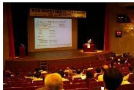
フォーラム (さいたま市)

主体間の意見交換・情報交換の場として容器包装 3R フォーラムやマスコミ懇談会、3R リーダー交流会を実施した。フォーラムは過去 5 都市で市民、行政関係者、学識研究者との交流・意見交換が持たれ、3R 推進に向けた課題の共有等に大きく寄与したものと考えられる。