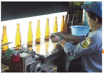
ガラスびんの検査