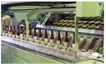
ガラスびんの洗浄

ガラスびんには、100年以上も前からリユースの仕組みがあり、ビールびん、一升びん、牛乳びんなどが、リターナブルびんとして繰り返し使われてきたよ。なぜ、リユースできるのかというと、ガラスびんは、中身のにおいや味が移らないため、使い終わった後に中をきちんと洗うと、何回も繰り返し使うことができるからなんだよ！