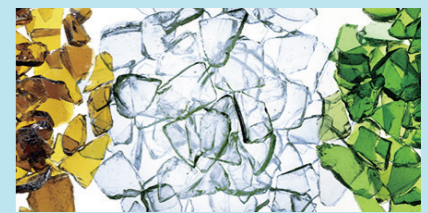
ガラスびんから作られたカレット

使い終わったガラスびんは、カレット工場で細かくくだかれて、新しいガラスびんの原料やその他の用途に再生利用されるよ。リサイクルしても品質も純度も変わらないため、何回でも永久にガラスびんに生まれ変わり続けることができるんだ！